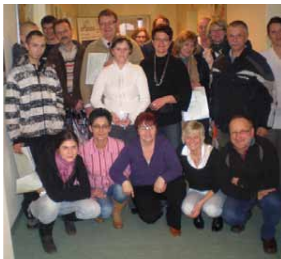
Zdjęcie uczestników projektu

Uczestnicy projektu ukończyli kurs komputerowy, wzięli udział w warsztatach psychologiczno-doradczych, podczas których uczyli się komunikacji interpersonalnej (panowie) i asertywności (panie), a po szkoleniu teoretycznym i praktycznej nauce jazdy samochodem przystąpili do egzaminu państwowego na prawo jazdy kat. B. Pomimo dużej różnicy wieku – najmłodszy uczestnik projektu miał 20 lat, a najstarsza uczestniczka – 57 lat, grupa mieszkańców gminy Głuszycy znakomicie się dogadywała i pracowała zespołowo, wzajemnie sobie pomagając. Udział we wszystkich kursach i warsztatach, materiały szkoleniowe, posiłki i transport na zajęcia, a także egzamin państwowy na prawo jazdy kat. B, były dla uczestników bezpłatne.