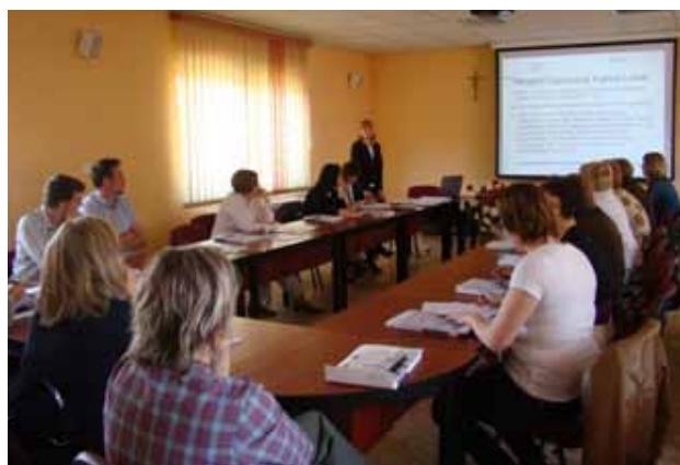
Zdjęcia ze spotkań w Jastrowiu i Okonku

Oprócz tego, Punkt Konsultacyjny Krajowego Systemu Usług w Pile już po raz trzeci zaprezentował swoją ofertę podczas Wielkopolskich Spotkań Gospodarczych, które odbyły się 28 maja na terenie pilskiego lotniska. Organizatorem tego wydarzenia była Izba Gospodarcza Północnej Wielkopolski, a było to jedno z największych wydarzeń kulturalnych na terenie powiatu pilskiego.