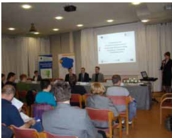
Zdjęcie z konferencji we Wrocławiu

17 maja Punkt Konsultacyjny KSU przy Wrocławskiej Agencji Rozwoju Regionalnego zorganizował konferencję regionalną pt. „W labiryncie funduszy unijnych – aktualne możliwości wsparcia dla przedsiębiorców”. Konferencja była poświęcona promocji bezpłatnych usług informacyjnych KSU oraz zaprezentowaniu oferty dostępnych form wsparcia dla przedsiębiorców. W wydarzeniu udział wzięło ponad 70 osób. Jako prelegenci w spotkaniu udział wzięli przedstawiciele m.in. Polskiej Agencji Rozwoju Przedsiębiorczości, Urzędu Miasta Wrocławia, Dolnośląskiej Instytucji Pośredniczącej, Banku Gospodarstwa Krajowego oraz Agencji Restrukturyzacji i Modernizacji Rolnictwa.