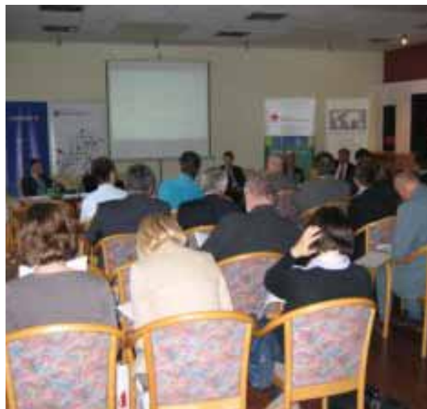
Zdjęcie z konferencji

Ekspert Fundacji zaprezentował jak dokonać oceny potrzeb technologicznych, aby usprawnić funkcjonowanie przedsiębiorstwa oraz jak uzyskać wsparcie we wdrożeniu technologii mogące przynieść dodatkowe korzyści związane z podwyższeniem konkurencyjności i pozycji rynkowej.