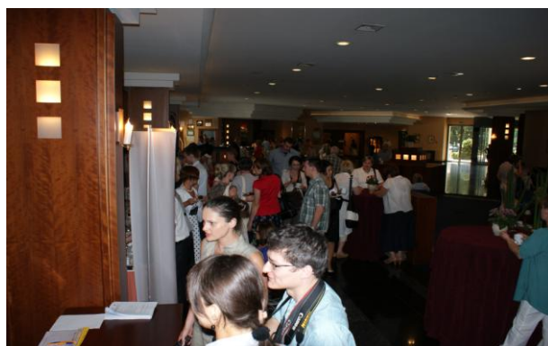
Dyskusje przenosiły się również w kuluary