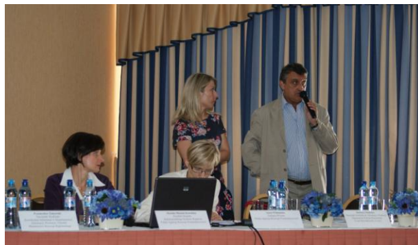
Przedstawiciele PK KSU przy Łódzkiej Agencji Rozwoju Regionalnego i Urzędu Marszałkowskiego Woj. Łódzkiego podzielili się dobrymi praktykami we współpracy regionalnej w woj. łódzkim

Spotkanie informacyjne zostało bardzo wysoko ocenione przez uczestników, w szczególności przez przedstawicieli sieci Punktów Informacyjnych o Funduszach Europejskich, dla których Punkty Konsultacyjne KSU stają się ważnym partnerem w obszarze zapewnienia i wymiany informacji oraz promowania wśród beneficjentów wsparcia możliwości, jakie niosą ze sobą środki publiczne.