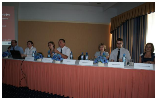
Przedstawiciele woj. zachodniopomorskiego, wielkopolskiego, świętokrzyskiego, podkarpackiego i dolnośląskiego podzielili się informacjami nt. prowadzenia usług informacyjnych oraz działań promocyjnych w swoich regionach